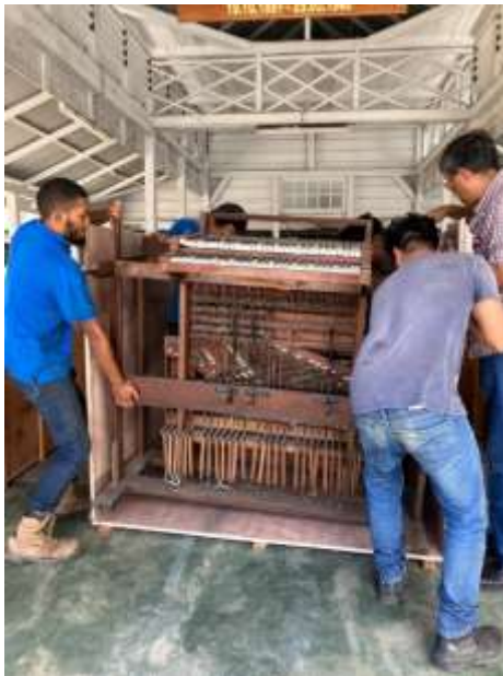
De speeltafel wordt gereedgemaakt voor verscheping naar Nederland

In het voorjaar van 2024 arriveerde bij de orgelmakers Pels & Van Leeuwen in Rosmalen (NL) een container met een groot aantal onderdelen van het Maarschalkerweerd orgel uit Suriname. De container bevatte de grotendeels gedemonteerde windladen, mechanieken, speeltafel en al het metalen pijpwerk.